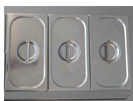
Konfigurationsbeispiele M40: 1xGN1/3 + 1xGN 1/1 VASCA M80: 2xGN1/3 + 2xGN 1/1 VASCA