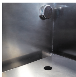
Wasserspender im Tank.